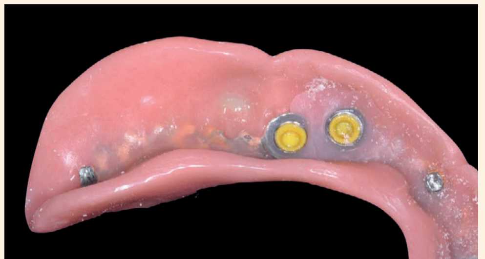
Figg. 11-12 - Resinatura definitiva delle cappette.