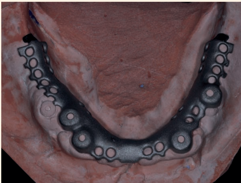
Figg. 6a-6b - Sovrastrutture.