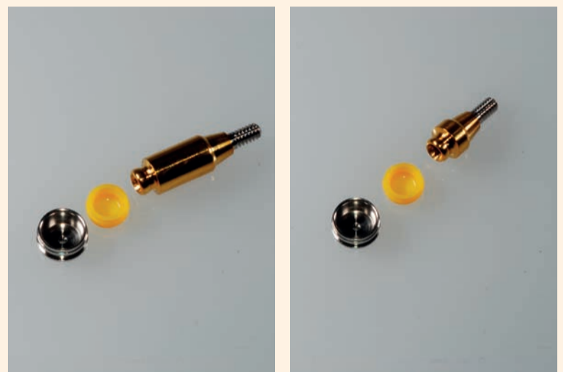
Figg. 2a-2c - Particolare degli attacchi OT Equator.