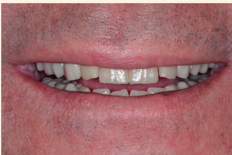
Figg. 4, 5 - Montaggio denti.