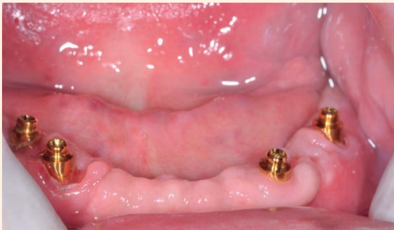
Fig. 1 - Attacchi OT Equator inseriti sugli impianti.

Il clinico, prima di fissare gli attacchi (Figg. 2a-2c), verificherà le inserzioni dei manufatti, eventuali compressioni con paste apposite e i contatti di centrica.