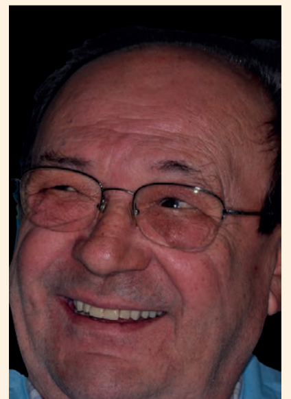
Figg. 13-18 - Protesi ultimata e consegna al paziente.